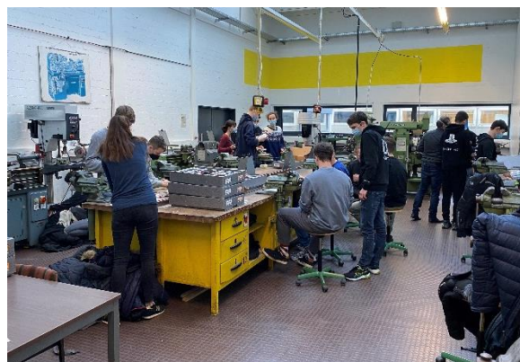
Am Werkeln... – Die TGT12 in der Werkstatt